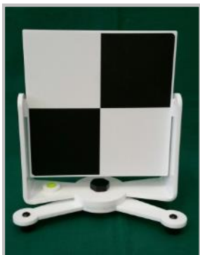
Easy Target su supporto