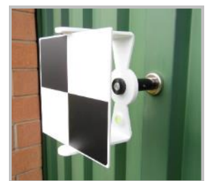
Easy Target con magnete