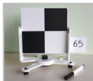
Easy Target con Target ID