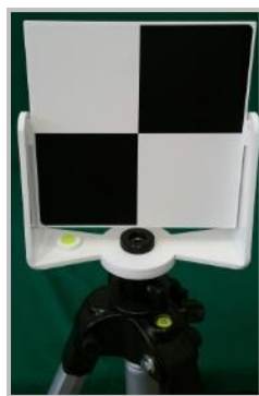
Easy Target su treppiede